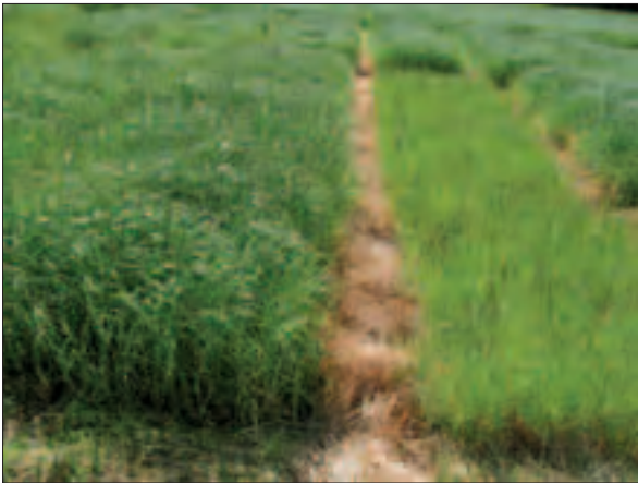
Bilde 2. Rutene som ikke var gjødslet (t.h.) var 14. juni tydelig preget av næringsmangel i feltet på Landvik.

verdiene med 23 % på Landvik og 6 % i Vestfold når N-mengden ble økt fra 10 (ledd 2-4) til 13 kg N/daa (ledd 5-7).