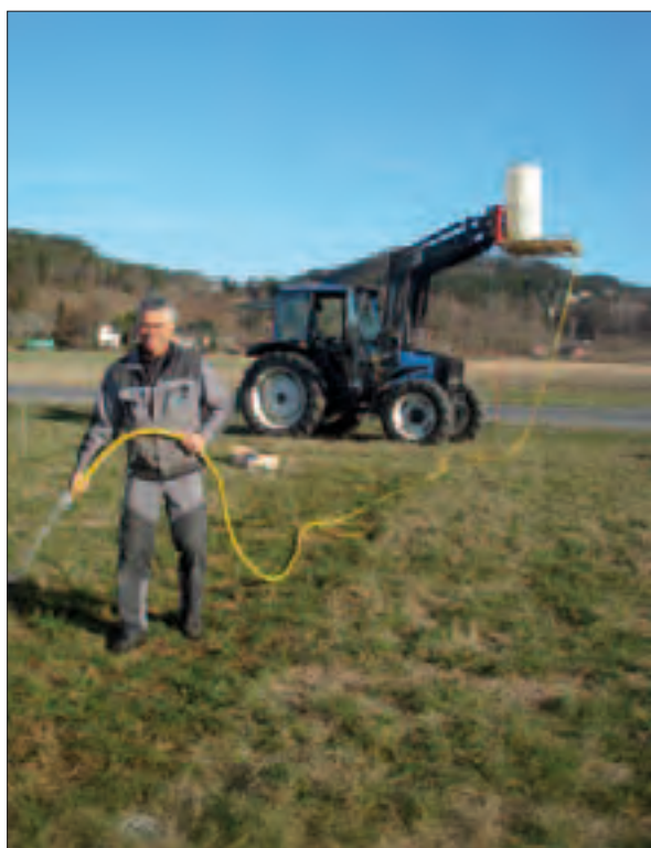
Bilde 1. Åge Susort, Bioforsk Øst Landvik, vanner ei rute med urea-gjødsel i feltet på Landvik 14. april 2010.