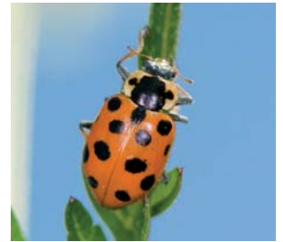
Trettenprykket mariehøne* Hippodamia tredecimpunctata Lengde: 4,5 - 7 mm Habitat: Våtmark Slekten har 5 arter i Norge