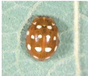
Fjortenprykket mariehøne Calvia quatuordecimpunctata Lengde: 4,5 - 6 mm Habitat: Løvfellende trær Slekten har 1 art i Norge