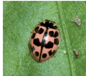
Oenopia conglobata Lengde: 4 - 5 mm Habitat: Løvfellende trær (F.eks: Prunus sp. og poppel) Slekten har ingen arter i Norge fra før Funn ønskes rapportert!