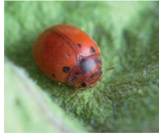
Tjuefireprikket mariehøne Subcoccinella vigintiquatuorpunktata Lengde: 3 - 4 mm Habitat: Gresseng Slekten har 1 art i Norge