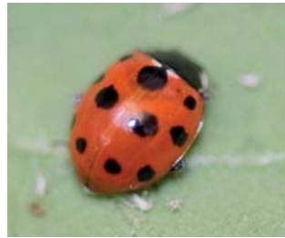
Elleveprykket mariehøne* Coccinella undecimpunctata Lengde: 3,5 - 4,5 mm Habitat: Generalist Slekten har 6 arter i Norge