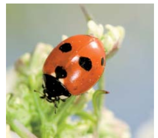
Femprykket mariehøne Coccinella quinquepunctata Lengde: 3 - 5 mm Habitat: Generalist Slekten har 6 arter i Norge