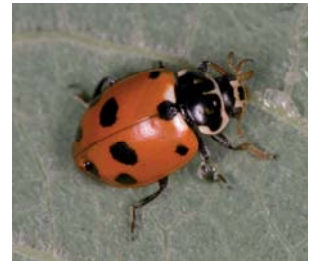
Adonis' mariehøne* Hippodamia variegata Lengde: 3,5 - 4,5 mm Habitat: Generalist Slekten har 5 arter i Norge