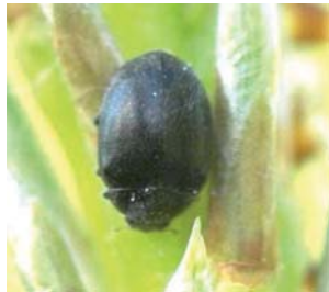
Scymnus sp. Lengde: 2 - 3 mm Habitat: Bartrær, furu Slekten har 12 arter i Norge