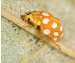
Sekstenprykket mariehøne* Halyzia sedecimpunctata Lengde: 5 - 7 mm Habitat: Løvfellende trær (eks. Ask) Slekten har 1 art i Norge