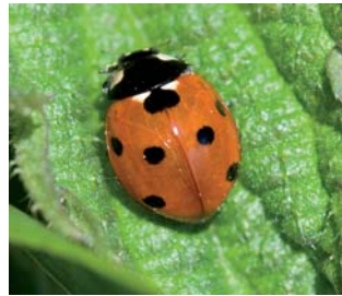
Syvprykket mariehøne Coccinella septempunctata Lengde: 5 - 8 mm Habitat: Generalist Slekten har 6 arter i Norge