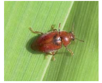
Smalmarihøne Coccinula rufa Lengde: 3 - 4 mm Habitat: Våtmark /dunkjevle Slekten har 2 arter i Norge