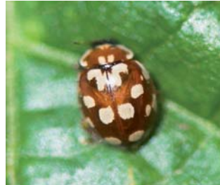
Åttenprykket mariehøne* Myrrha octodecimpunctata Lengde: 3,5 - 6 mm Habitat: Nåletrær Slekten har 1 art i Norge