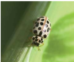
Nittenprykket mariehøne* Anisosticta novemdecimpunctata Lengde: 3 - 4 mm Habitat: Våtmark, takrør/ dunkjevle Slekten har 2 arter i Norge