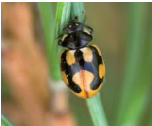
Hieroglyfmariehøne* Coccinella hieroglyphica Lengde: 4 - 5 mm Habitat: Lynghei Slekten har 6 arter i Norge