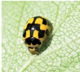
Sjakkbrettmariehøne* Propylea quatuordecimpunctata Lengde: 3,5 - 4,5 mm Habitat: Generalist Slekten har 1 art i Norge