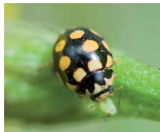
Svart fjortenprykket mariehøne* Coccinula quatuordecimpustulata Lengde: 3 - 4 mm Habitat: Gresseng Slekten har 1 art i Norge