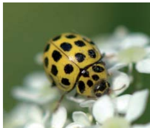
Tjuetopprykket mariehøne* Psyllobora vigintiduopunctata Lengde: 3 - 4,5 mm Habitat: Gresseng Slekten har 1 art i Norge