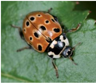
Øyeflekket mariehøne* Anatis ocellata Lengde: 7 - 9 mm Habitat: Nåletrær Slekten har 1 art i Norge