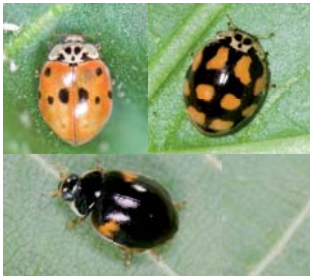
Tipprykket mariehøne* Adalia decempunctata Lengde: 4 - 5 mm Habitat: Busker, skoglandskap Slekten har 4 arter i Norge