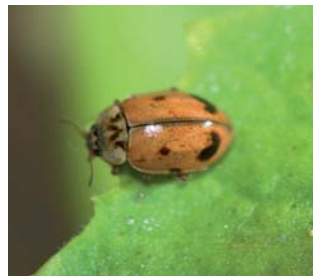
Aphidecta oblitterata Lengde: 3,5 - 5 mm Habitat: Nåletrær Slekten har 1 art i Norge