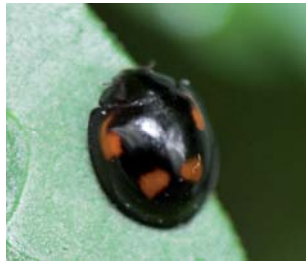
Exochomus quadripustulatus Lengde: 3 - 5 mm Habitat: Nåletrær Slekten har 1 art i Norge