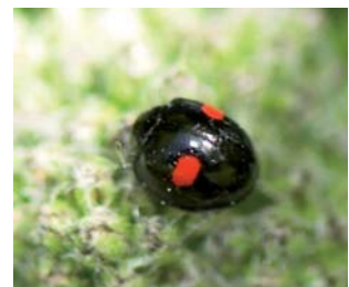
Chilocorus renipustulatus Lengde: 3 - 4,5 mm Habitat: Løvfellende trær Slekten har 2 arter i Norge