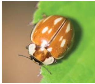
Stripet mariehøne* Myzia oblongoguttata Lengde: 6 - 8 mm Habitat: Nåletrær Slekten har 1 art i Norge