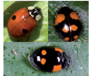
Topprykket mariehøne Adalia bipunctata Lengde: 3,5 - 5,5 mm Habitat: Generalist Slekten har 4 arter i Norge