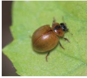
Vingeløs mariehøne* Cynegetis impunctata Lengde: 3 - 4,5 mm Habitat: Gresseng Slekten har 1 art i Norge