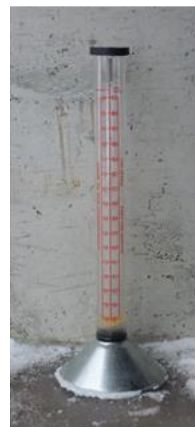
Bilde 1. Vestfold frøavlslag disponerer dette flowmeteret.