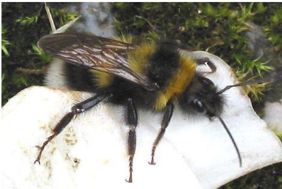
Bilde 1. Hagehumla har lang tunge og er effektiv til å pollinere rødkløver. Den trives også på andre erteplanter som blomkarse, sibirertebusk, gullregn og åkerbønne. (Kilde: Wikipedia).

Blant de korttunga humlene forekommer en del tyvhumler som røver nektar uten å utføre bestøvning. Disse tyvhumlene biter hull på kronrøret og suger ut nektaren der i stedet for å stikke tunge inn den vanlige veien. Hullene som tyvhumlene lager kan seinere benyttes av andre humler eller bier, som dermed heller ikke vil pollinere. Dessverre viser studier at bestanden av langtunga humler har avtatt, mens bestanden av korttunga humler har økt de siste 50 åra.