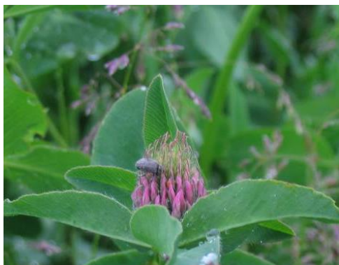
Bilde 3. Kløvergnager

temperaturavhengig som innflyginga av rødkløversnutebiller. Ganske ofte blir det observert kokonger (parasitterte pupper) av kløvergnager ved rensing av norske rødkløverpartier, og noen frøavlere har funnet det voksne skadedyret på frøtørka. Alt i alt antar vi derfor at kløvergnager gjør vel så stor skade som rødkløversnutebillene i frøavlsdistriktene sør for Oslo. Forekomsten er likevel nokså sporadisk, med flest funn hos bestemte frøavlere i Østfold og Telemark. I Hedmark har det ikke vært funnet kløvergnager.