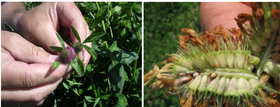
Bilde 2. Voksne individer (t.v.) og larver (t.h.) av rødkløversnutebille.

Av rødkløversnutebiller fins det tre arter på Østlandet. Felles for dem er at det voksne individet er 1-2 mm langt og overvintrer i vegetasjonen rundt frøengene, spesielt i strøsjiktet i barskog. Når dagtemperaturen flere dager på rad kommer opp i ca 20°C, flyr de inn i frøenga og gnager tett i tett med små hull i bladene (næringsgnag eller hullgnag, som ikke må forveksles med sneglegnag som er mer uregelmessig og der det ofte blir igjen rester av bladets overflatehinne. Deretter legger snutebillene egg i blomsterknoppene. Eggene klekker til larver som gnager på frøanlegga, seinere frøene, inni belgene i hvert blomsterhode. På ettersommeren forpupper larvene seg, og etter klekking kan de voksne individene igjen foreta næringsgnag på bladene før de flyr til overvintringsstedene rundt frøenga.