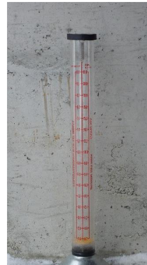
Bilde 4. Vestfold frøavlerlag disponerer dette flowmeteret.

Vanninnholdet i frøet vil hele tiden stå i likevekt med den relative fuktigheten i tørkelufta. Heldigvis er vanninnholdet ved en og samme luftfuktighet lavere i kløverfrø enn i grasfrø, og i praksis byr det derfor sjelden på problemer å få frøet ned i de foreskrevne 12% vann. Når vanninnholdet i frøet er kommet ned i ca 18% må vi begynne å slå av vifta om natta, da luftfuktigheten er høyest. Seinere blir det aktuelle tidsrommet for tørking mindre og mindre, til sist bare noen timer midt på dagen. For å ta ut de siste