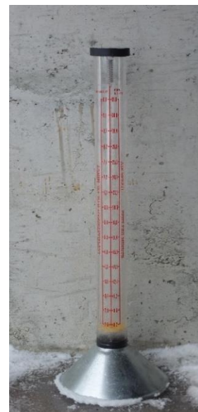
Bilde 2. Vestfold frøavlerlag disponerer dette flowmeteret

Vanninnholdet i frøet vil hele tiden stå i likevekt med den relative fuktigheten i tørkelufta. Når vanninnholdet i frøet er kommet ned i ca 18% må vi derfor begynne å slå av vifta om natta, da luftfuktigheten er høyest. Seinere blir det aktuelle tidsrommet for tørking mindre og mindre, til sist bare noen timer midt på dagen. Frøet skal tørkes helt ned til 12% vann, tilsvarende en luftfuktighet på ca 50%. For å ta ut de siste prosentene kan det være aktuelt å sette forsiktig varme til tørkelufta slik at luftfuktigheten går ned. Men vi må være veldig forsiktig med oppvarming av lufta ved tørking av rått frø med over 30% vann.