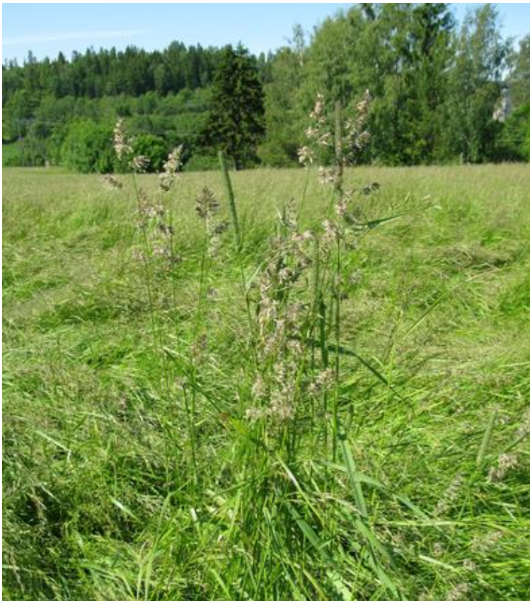
Hundegrass kan være vanskelig å rense fra engsvingelfrøet og bør lukes bort før høsting.

Kveka må bekjempes med planmessig bruk av glyfosat i åra før gjenlegg. Dersom en er redd for at det fortsatt er kveke igjen på arealet i gjenleggsåret, vil det beste være å så engsvingelen uten dekkvekst. Kveka bør da vokse uforstyrret fra våren av, og så sprøytes med glyfosat ca 1 uke før jordarbeiding og såing av engsvingelen.