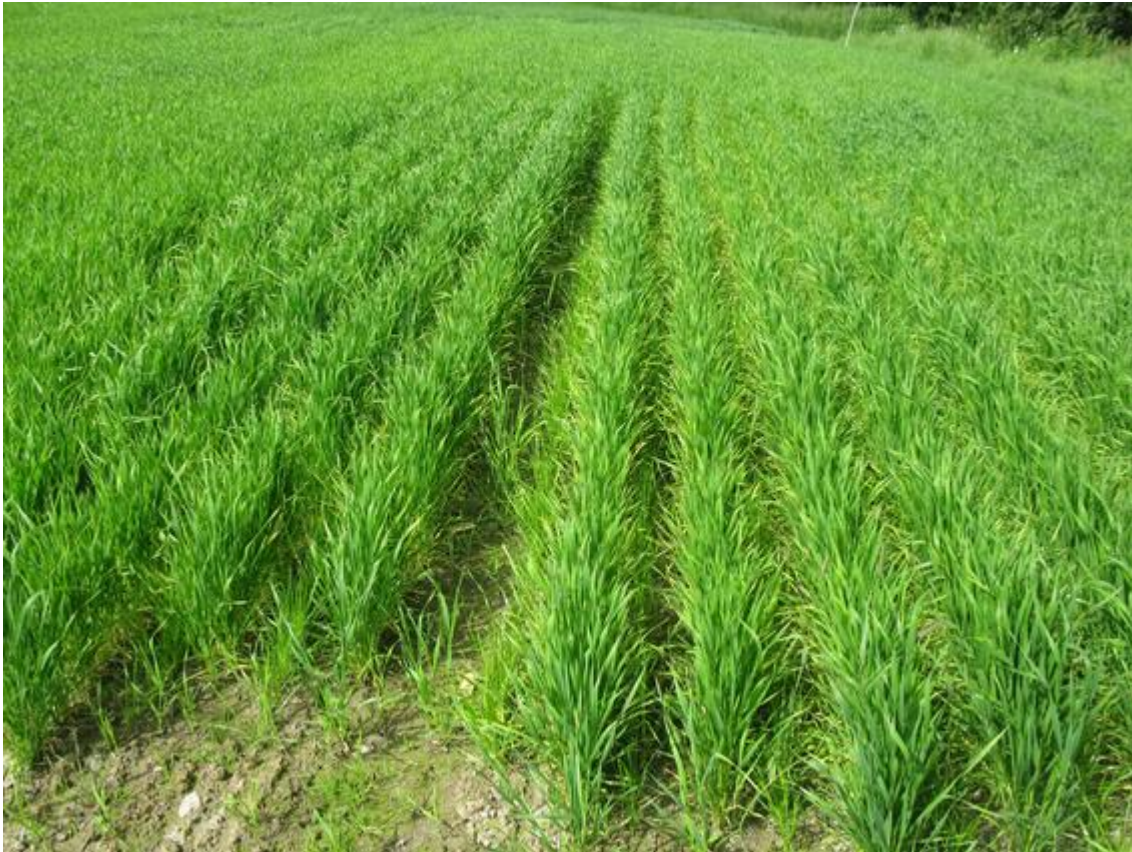
Etablering av engsvingel sådd i annenhver sålabb med Bjarne vårhvete som dekkvekst.