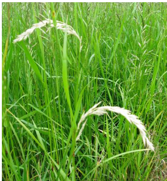
Kvitaksmidd kan særlig være problem i eldre frøeng.

Angrepene av skadeinsekter, spesielt kvitaksmidd , øker normalt utover i engåra. Spesielt stort behov for insektsprøyting vil det være hvis det i tidligere år har vært angrep i området. I forsøk i tredjeårseng har insektsprøyting hatt en klar positiv virkning på frøavlingen, også i de tilfeller hvor en ikke har observert synlige insektskader. Tredjeårs engsvingelfrøeng bør derfor sprøytes med pyretroid (Fastac 50 (30 ml/daa) eller Karate 5 CS (15 ml/daa) ved begynnende strekningsvekst i slutten av mai. Denne sprøytinga kan med fordel kombineres med vekstregulering med Moddus (se under). I første- og andreårseng anbefales ikke rutinemessig insektsprøyting.