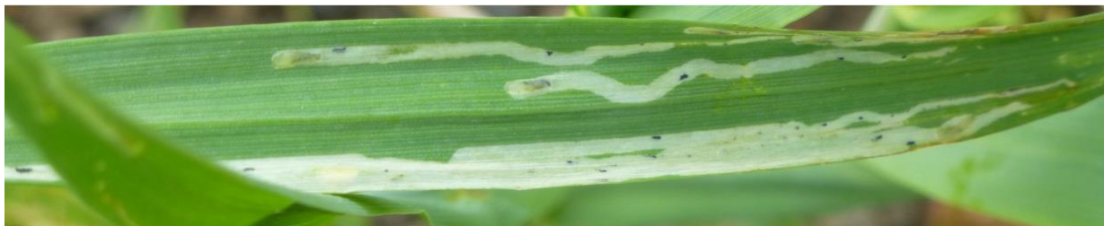
Bladminerflue kan enkelte år gjøre stor skade.

Bladminerflue angriper alle kornarter og mange grasarter, deriblant engsvingel, men er som oftest lite avlingsreducerende. I noen år kan imidlertid frøavlingen bli redusert, spesielt hvis flaggbladet blir sterkt angrepet, og sprøyting er nødvendig. Det anbefales å sprøyte like før flaggbladet kommer til syne dersom det er mer enn 1 / 3 minert bladareal på de nedre bladene, og det samtidig er næringsstikk på de øvre bladene (dvs. at angrepet fortsatt er under utvikling). Det kan brukes pyretroid (Fastac eller Karate).