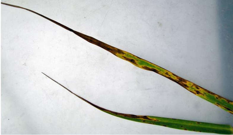
Blad av engsvingel angrepet av engsvingelbrunflekk.

Mot soppjukdommer i engsvingelfrøeng har medlemmer av Norsk frøavlerlag off-label godkjenning for sprøyting med Proline i dosen 40 - 80 ml/daa. Ansvarserklæring skal nedlastes fra https://www.froavlerlaget.no/off-label-godkjenninger , underskrives og oppbevares i frøavlerens internkontrollsystem.